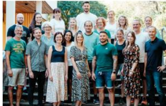
Das Kollegium der Otterstein WRS Pforzheim